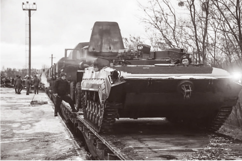
2022년 1월, 철도를 통해 벨라루스로 수송된 러시아 전차들. 이때 러시아-벨라루스 합동군사훈련 명목으로 벨라루스-우크라이나 국경에 러시아 병력이 배치되었다.

알렉산드르 루카셴코가 1994년부터 현재까지 대통령직에 있다. 루카셴코 대통령은 러시아가 우크라이나를 침략하도록 국경을 내주었을 뿐 아니라, 러시아를 지원하기 위해 파병할 가능성도 제기되고 있다. 이에 벨라루스민주노총(BKDP)은 러시아와 자국 정부를 강력하게 규탄했다. 전쟁 개시 당일 발표한 성명에서 “정부의 부끄러운 행위에 대해 벨라루스 노동자를 대표하여 우크라이나의 동료들에게 머리 숙여 사과한다”며 우크라이나 민중에게 연대를 표하고 러시아가 우크라이나와 벨라루스에서 군대를 철수할 것을 촉구했다. 핵무기 반입을 위한 개헌 국민투표가 실시된 2월 27에는 전국 각지에서 반전시위가 열렸고 최소 290명이 체포됐다. 벨라루스민주노총은 “벨라루스인의 절대 다수인 97%는 벨라루스가 우크라이나 전쟁에 참여하는 것을 원하지 않는다! 우리의