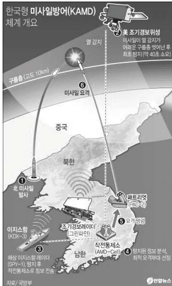
[그림 1] 한국형 미사일방어 체계 개요

3-4월 ‘치킨 게임’을 방불케 한 한미연합전력 대 북한의 군사적 대결이 4월 중순 들어 잠시 숨고르기에 들어간 것처럼 보였지만, 4월 말 개성공단이 잠정 폐쇄되기에 이르렀습니다. 4월 말로 한미연합훈련이 종료되고 5월 정상회담에서 일정한 국면 전환이 예상되는 상황에서 기선을 제압하기 위해 양측이 ‘밑당’하는 것이라는 관측이 많은데요.