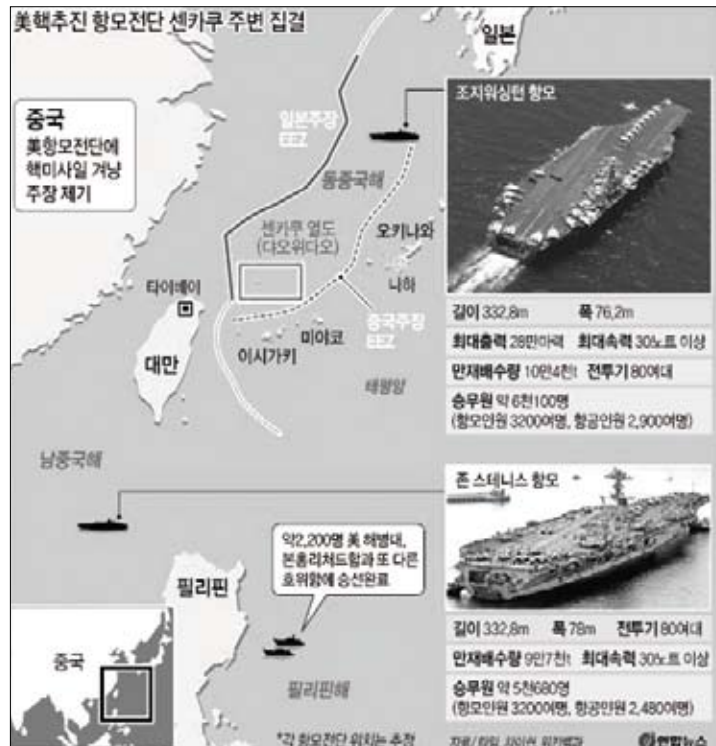
[그림5] 2012년 조어도 분쟁 당시 미국함모전단현황

하는 센카쿠 열도를 비롯한 일본의 낙도 탈환훈련에 일본은 그 간 육군만 파견해왔으나 이번 2013년 합동훈련에는 일본 육해공군 자위대를 파견하는 방안이 논의 중이라고 합니다.