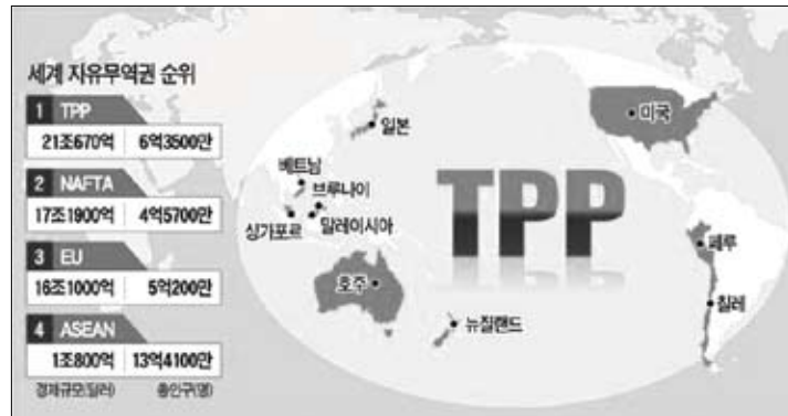
[그림4] 동북아시아와 미국의 경상수지 및 對GDP 비율

미국은 올 연말까지 TPP 협상을 타결한다는 목표를 가지고 있지만, 현실적으로 많은 난관이 존재합니다. 민감품목의 예외 취급 방식, 관세철폐 원칙에 대해 합의하지 못하고 있고, 원산지 규정, 투자, 정부조달, 경쟁정책 등의 분야에서도 이견이 지속되고 있는 상황입니다. 여기에 일본이 협상국으로 추가되면, 협상이 좀 더 어려워질 것이라는 전망도 있습니다.