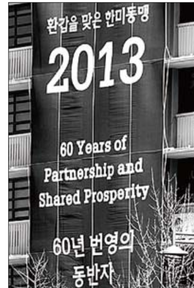
▲ 주한미국대사관 외벽에 ‘환갑을 맞은 한미동맹 2013, 60년 번영의 동반자’라는 문구의 플래카드가 걸려 있다.