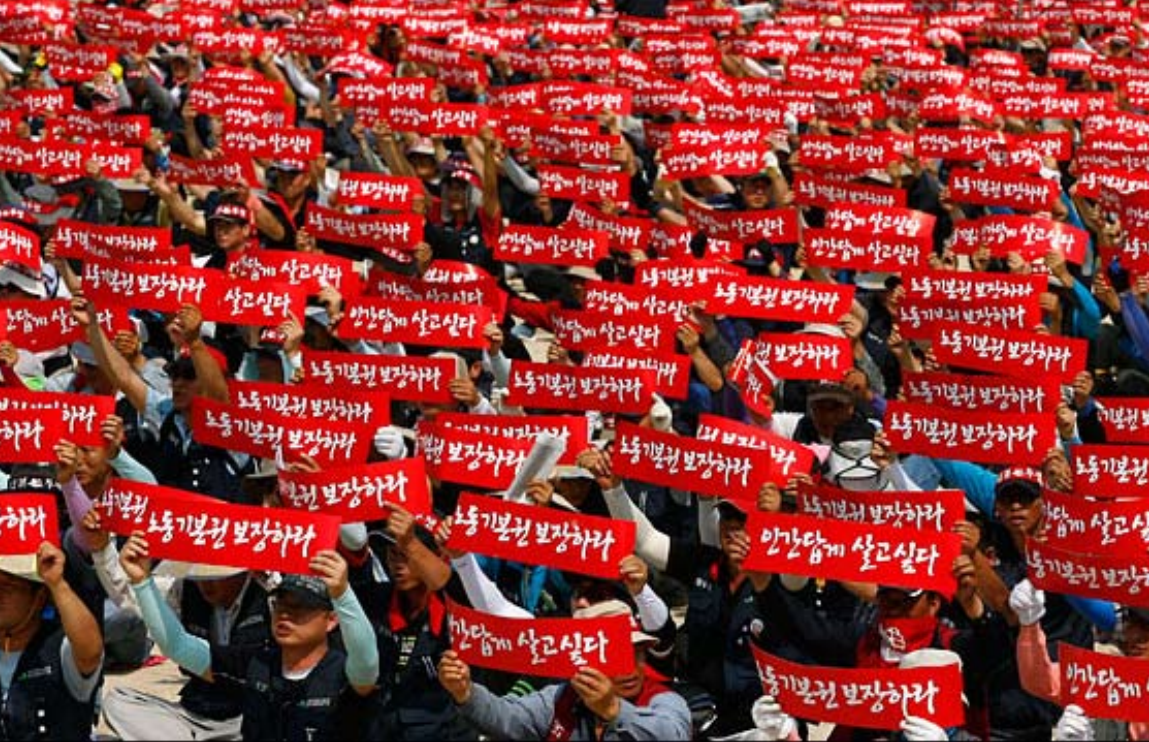
▲ 노동기본권 보장하라