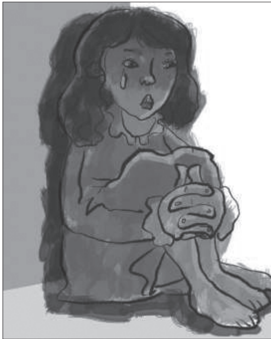
▶ 대중문화로 재현되는 임신중지 여성은 불운한 상황에 피로워하면서도 침묵하는 존재이다. (이미지 출처 '낙태')

한편 1973년 미국에서 '로 대 웨이드 판결'로 임신중지가 합법화된 후 교회로부터 자금 지원과 편달을 받아 미국 국가생명권위원회가 출범한 것과 같이, 같은 해 호주에도 반임신중지 조직인 RTL이 교회의 재정 지원을 통해 설립됐다. RTL의 정치는 극도로 태아 중심적이었다. 실제보다 더 크게 그려진 태아, 자궁 바깥에서 탯줄 없이 어린아이처럼 서 있는 태아, 훼손된 태아가 쓰레기통에 담긴 모습 등 태아 이미지 사용과 반임신중지 진영에 속한 의사들의 증언은, 본래 신학적인 주장이던 것을 객관적인 유사과학으로 탈바꿈하고자 하는 RTL의 핵심전략이었다. RTL은 임신