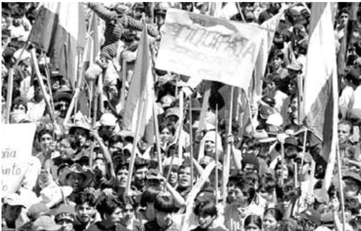
▲ 물 민영화에 반대하는 코치밤바의 민중들

그러나 강제적인 신자유주의 구조조정은 재앙이었다. 리처드 피트가 쓴 『불경한 삼위일체』에 따르면, 아프리카에서 세계은행과 국제통화기금은 사회·경제 활동에 대한 국가의 지원과 보호를 줄일 것을 요구했다. 그 결과 세계은행과 국제통화기금의 보호 아래에 있었던 남부 아프리카의 대다수 국가에서 1인당 국민소득이 1980년대 동안 25퍼센트나 감소하였다. 식량과 농업 보조금 철폐는 가격 상승으로 이어져, 남부 아프리카의 1/4~1/3에 해당하는 인구가 만성적인 영양부족 상태에 처하였다. 보건복지 분야의 예산이 삭감되고 의료가 민영화되면서 공중보건 사업도 오히려 퇴보되었다. 그 결과 20년 동안 아프리카 사람들의 평균 수명이 15년이나 줄어들었다.