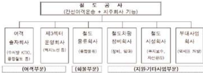
[그림2] 박근혜 정부의 철도공사 분할 민영화 방안

년 사이에 철도공사의 자회사인 별도 회사를 설립한다. 결국 간선철도 중심의 여객운송업을 제외한 모든 역할을 철도공사로부터 분리시키겠다는 것이다. 이는 현 철도산업의 근간을 뒤흔드는 것으로, 이명박 정부가 내놓았던 것보다 한층 더 나아간 파격적인 안이라 할 수 있다.