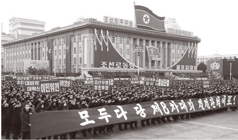
2021년 1월 15일 평양시에서 열린 군민연합대회. “모두 다 당 제8차대회 결정 관철에도!”란 대형 현수막을 비롯하여 조선노동당 8차 당대회에서 강조된 ‘정면돌파전’, ‘이민위천’, ‘일심단결’, ‘자력갱생’ 등의 구호가 눈에 띈다.

이다. 《로동신문》은 이번 당 규약 서문의 조국통일을 위한 투쟁과업 부분에 “강력한 국방력으로 근원적인 군사적 위협들을 제압하여 조선반도의 안정과 평화적 환경을 수호”한다는 것이 명확히 들어갔으며, 이는 “강위력(強偉力)한 국방력에 의거하여 조선반도의 영원한 평화적 안정을 보장하고 조국통일의 역사적 위업을 앞당기려는 우리 당의 확고부동한 입장의 반영”이라고 설명했다. 그런데 이것은 7차 당대회 때 규약의 “우리 민족끼리 힘을 합쳐 자주, 평화통일, 민족대단결의 원칙에서 조국을 통일”이라는 문구를 대체하는 것이다.