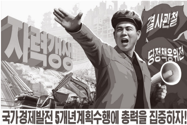
10월 29일 북한 《로동신문》에 실린 삽화.

에 대한 관리력과 국경 통제 능력과 같은, 현대 국가의 중심적인 통치 수단 몇 가지를 사실상 잃었다. 그 결과 부패, 밀수, 불법적인 국경 넘기가 횡행했다. 그러나 통치력을 되찾겠다는 의도로 강화되는 사회 통제는, 북한 주민들이 겪고 있는 경제난을 심화하고, 한국 드라마를 즐기는 무고한 이들에게 이전보다 훨씬 더 가혹한 처벌을 내릴 위험을 안고 있다고 우려한다.