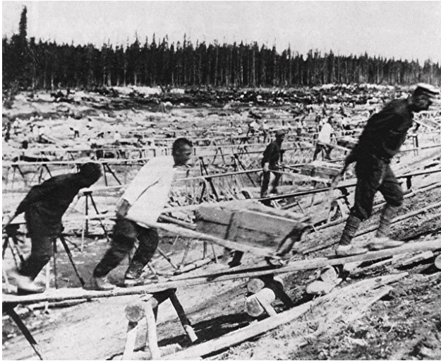
발트해 운하 건설에 동원된 굴라크 죄수들(1932년). 굴라크 노동수용소는 '소비에트 인간'의 틀에 맞지 않는 인간들을 개조하는 것이 명분이었다. 굴라크 노동은 소련 경제에서 중요한 역할을 했는데, 제2차 세계대전 당시에는 막대한 인력을 동원하기 위해 대량 체포가 이뤄지기도 했다.

급의 적으로 낙인 찍힌 사람들은 고등교육과 직업 등에서 배제됐고, 박해와 체포의 위협에서 자유롭지 못했다.