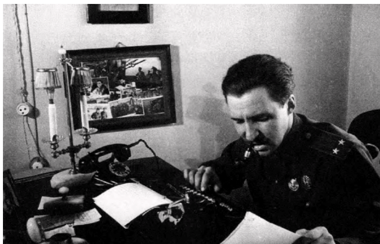
스탈린처럼 콧수염을 기르고, 머리를 뒤로 빗어 넘기고, 파이프를 문 콘스탄틴 시모노프.