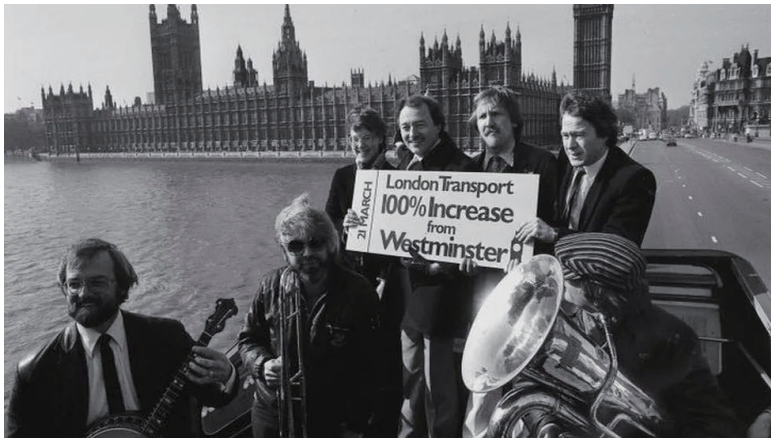
1982년, 버스를 타고 런던 시내를 돌며 ‘공정한 요금’ 캠페인을 홍보하는 켄 리빙스턴과 GLC 의원들.

내가 언제나 생각하는 것처럼, 대처 정부는 이들이 사회세력 간의 새로운 연합으로서, 잠재적으로 대중적이고 효과적이라고 무의식적으로 인식했기 때문에 침대에서 목을 졸라 죽이고픈 욕망을 느꼈고, 그래서 GLC를 파괴하고 지방정부에 대한 공격의 강도를 높였을 것이다. 이