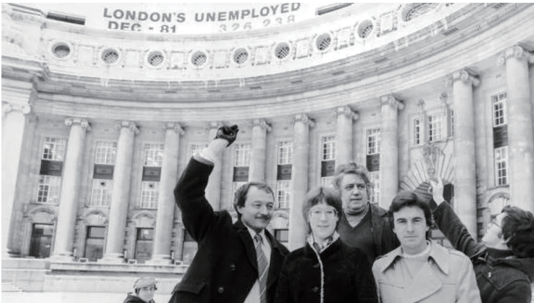
런던 카운티 홀에 설치한 “1981년 12월 런던의 실업자: 326,238명” 옥외광고판을 공개하는 켄 리빙스턴과 GLC 의원들.

가치와 임무를 다시 생각해보지 못했다. [대처, 메이저 시기에] 반대파는 모든 전선에서 후퇴했고, 그들의 철학은 (예컨대, 동유럽에서 이른바 ‘국가사회주의’ 실험의 해체, 서유럽에서 복지자본주의의 쇠퇴와 같은) 광범위한 역사적 변화 때문에 혼란을 겪었으며, 따라서 우파의 프로젝트를 차단하는 데 (성공을 거두는 것은 고사하고) 충분히 깊숙하게, 또는 역사적으로 유의미하게 개입할 수 없었다. 그 대신에 그들은 계속해서 수세적인 태도를 취했다. 특히나 그들은 구래의 개혁세력을 더 새로운 세력, 즉 신사회운동 중 그 누구와도 연결하는 데 실패했다. 우리가 앞에서 논증한 것처럼, 신사회운동은 우리가 현재 경험하고 있는 더욱 파편화된 정치지형 속에서 부상하고 있고 그러한 정치지형의 특징이다.